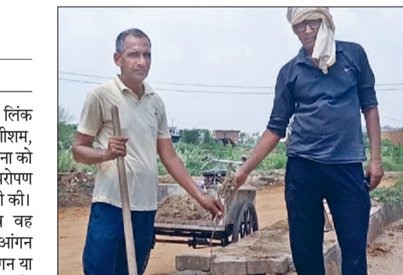
गोहाना। पौधरोपण करते हुए संगठन के सदस्य।