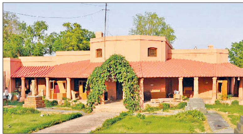
हिसार स्थित जॉर्ज कोटी जो जॉर्ज थॉमस का निवास स्थान थी, इसे वर्तमान में जहाज कोटी के नाम से जानते हैं। हांसी के प्राचीन किले के अवशेष जहां जॉर्ज ने अपने राज्य की राजधानी स्थापित की।

जार्ज के पश्चिम में स्थित जहाजगढ़ गांव के इर्द गिर्द महीने भर तक भीषण युद्ध हुआ था। दिल्ली दरबार पर मराठों का वर्चस्व कायम होने पर उन्होंने आयरलैंड वासी अपने एक कमांडर को इज्जर की जागीर प्रदान की थी। जार्ज थॉमस नामक यह अधिकारी कुछ ही महीनों में इतना शक्तिशाली बन गया कि उसने न केवल जहाजगढ़ में एक किला बना लिया बल्कि मराठों से स्वतन्त्र होकर अपना एक नया राज्य ही स्थापित कर लिया था। ये सभी गतिविधियाँ वर्ष 1794 से 1801 के मध्य की गई थीं। दिल्ली की तलहटी से लेकर हांसी-हिवा तक गठित अपने राज्य का नाम सर्वप्रथम हरियाणा उसी ने रखा था लेकिन उसके इतना बलशाली एवं स्वतन्त्र होने पर मराठों को दिल्ली के लिए खतरा अनुभव होने लग गया था। तब वर्ष 1801 में मराठा मुखिया सिधिया ने अपने कमांडर जनरल पैरो को