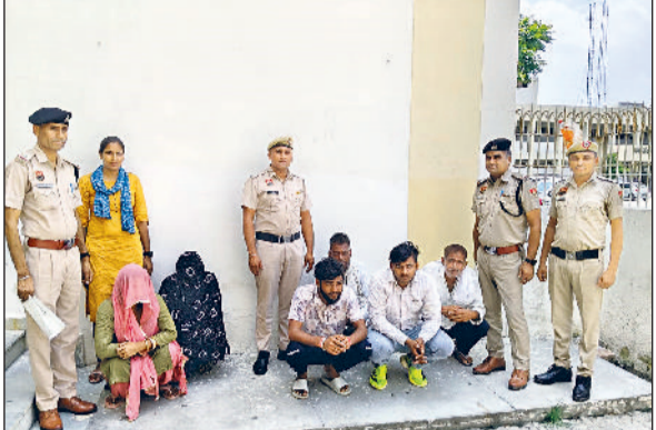
सोनीपत। पुलिस द्वारा ऑपरेशन प्रहार चलाकर गिरफ्तार किए गए आरोपित।

संदिग्ध वाहनों की भी तलाशी ली टीमों ने सड़कों पर चल रहे संदिग्ध वाहनों की तलाशी ली और ट्रैफिक नियमों के उल्लंघन पर 214 चालान जारी किए गए। साथ ही आमजन को सड़क सुरक्षा और यातायात नियमों के पालन के प्रति जागरूक भी किया गया। पुलिस प्रवक्ता के अनुसार,